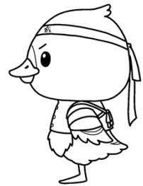
みやぎハローワークキャラクター 「ガンちょーさん」