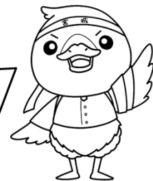
みやぎハローワークキャラクター 「ガンちよーさん」