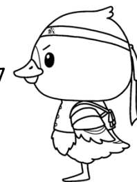
みやぎハローワークキャラクター 「ガンちょーさん」