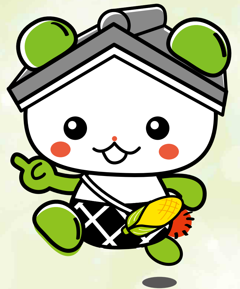
村田町観光PRキャラクター 「くらりん」 承認番号 第R4-1号

村田町では、 電力、ガス、食料品等価格の 高騰の影響を受けた 地域住民支援を目的として、 地元経済応援クーポン券を 配布します。