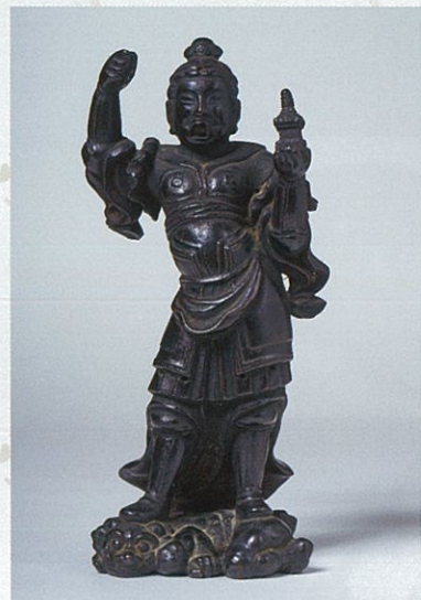
毘沙門天像(龍島院所蔵)

領民は、肉親を失ったように悲しんだが、宗高の分も必死に生きようと誓った。刈田岳山頂には、宗高命願跡石碑が建立されている。また、菩提寺の龍島院では、命日の八月十七日、花火大会が開催されている。村田の英雄の宗高のことを、忘れないために…。