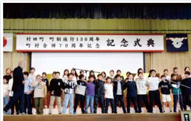
肩を組み合いリズムに合わせ歌を披露！