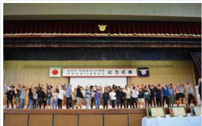
みんなで声を掛け合いガッツポーズ！