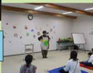
つばきの会さん 「はらぺこあおむし」