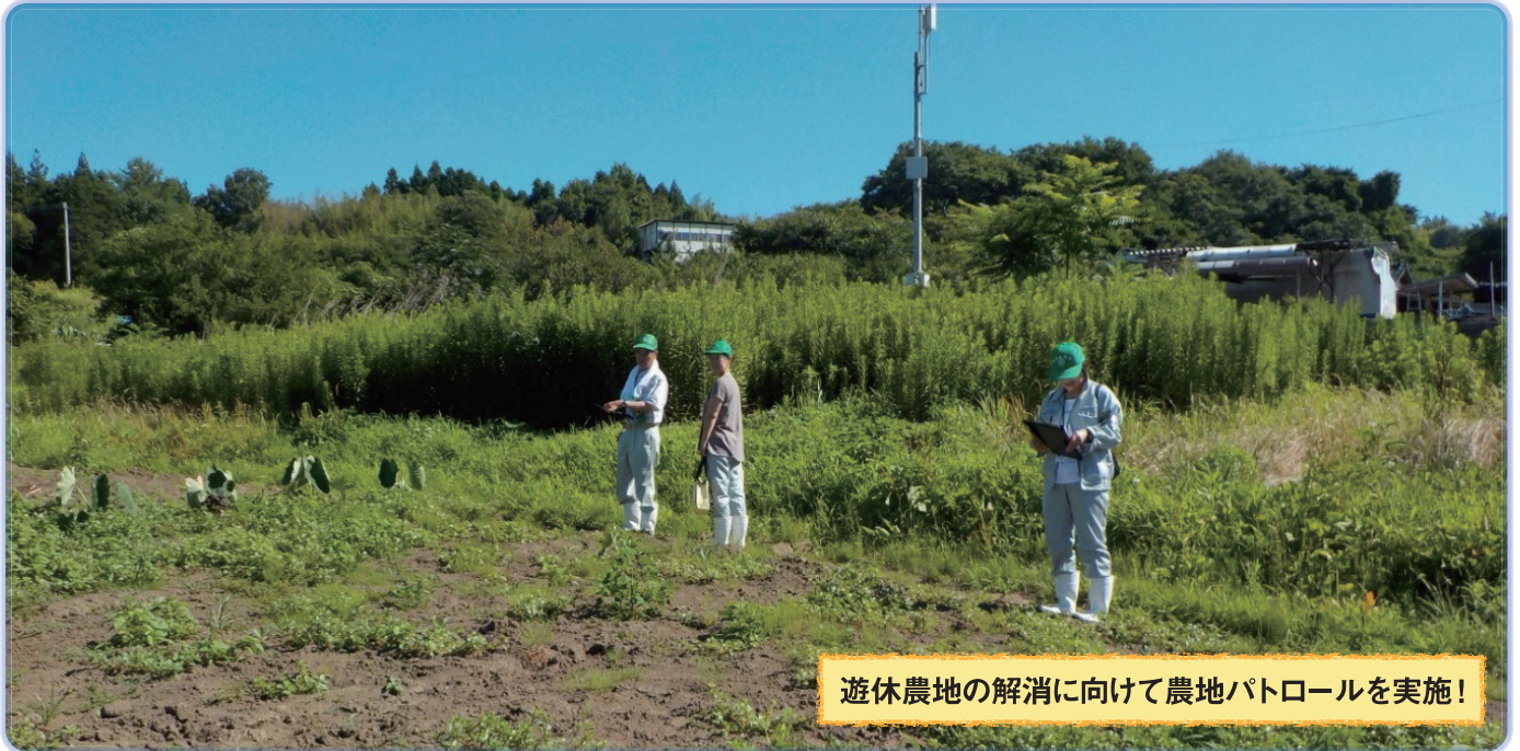
遊休農地の解消に向けて農地パトロールを実施!

農業委員会では、農地法に規定されている遊休農地の解消に向け、毎年、利用状況調査(農地パトロール)を実施しています。