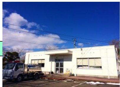
村田町水道事業所