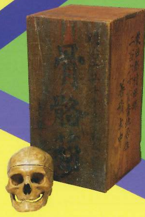
人体骨格標本 明治15年(1882) 善積医院資料