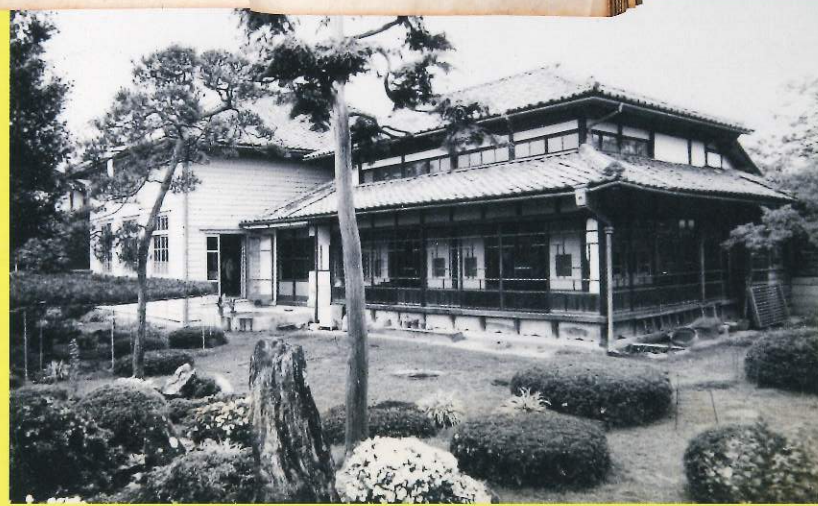
旧善積医院 大正2年頃築