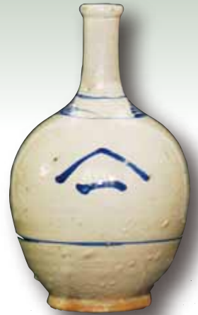
徳利 明治頃 個人蔵 「ヤマイチ 酒店」と入っている。