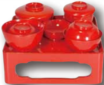
赤漆塗膳 明治~大正 個人蔵