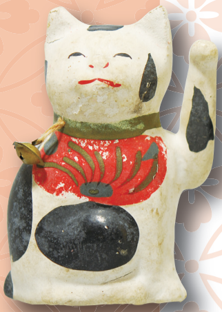
招き猫張子 明治時代 個人蔵