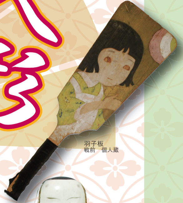
羽子板 戦前 個人蔵

歴史みらい館恒例の、雛人形の展示。 羽子板や人形など、女の子のかわいいおもちゃも展示いたします。