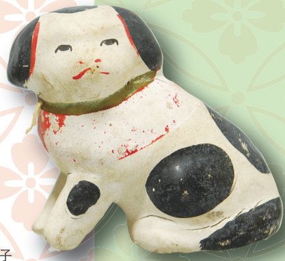
犬の張子 明治時代 個人蔵