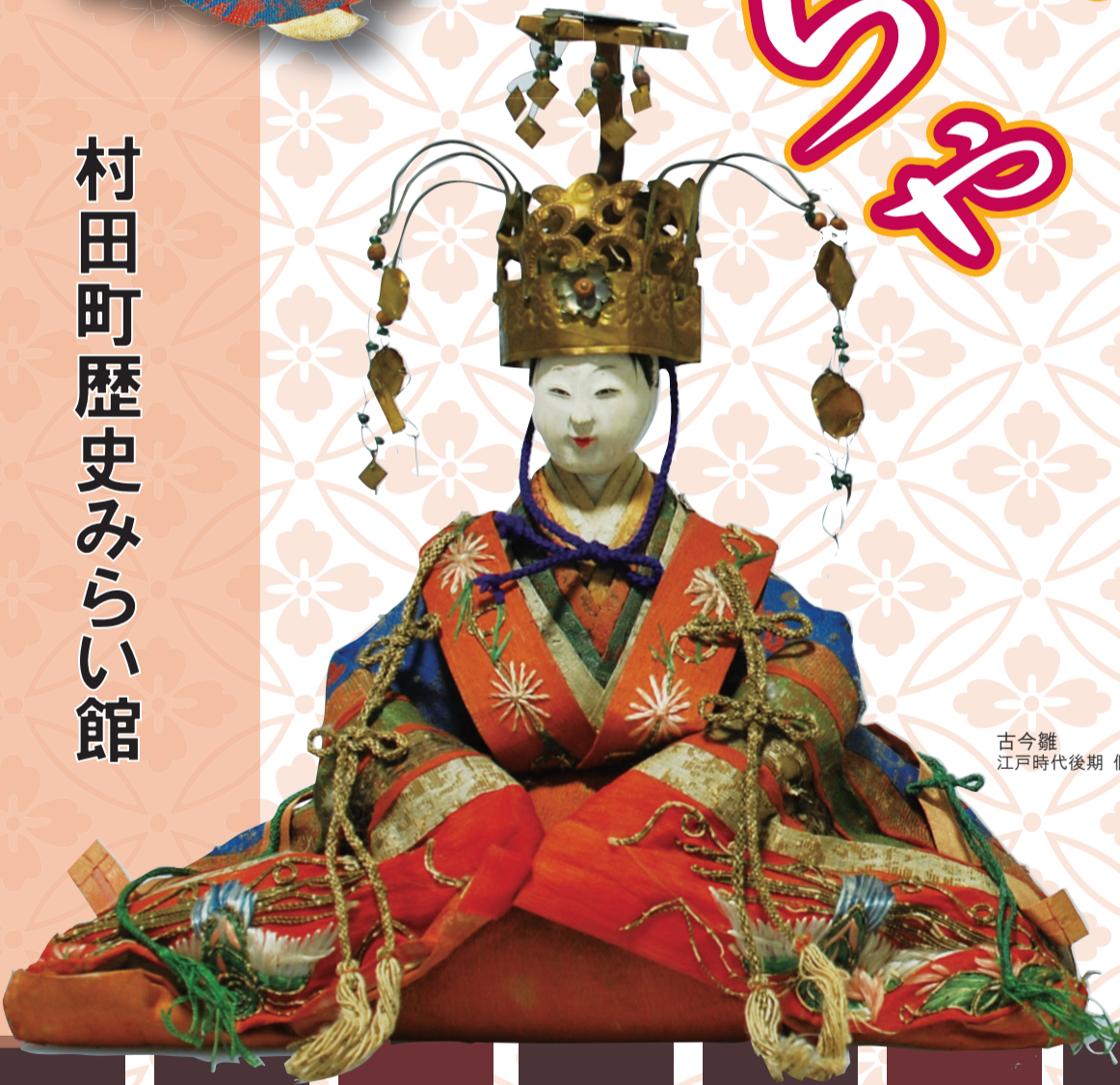
古今雛 江戸時代後期 個人蔵