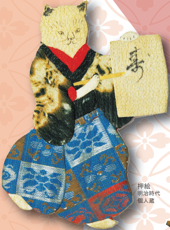
押絵 明治時代 個人蔵