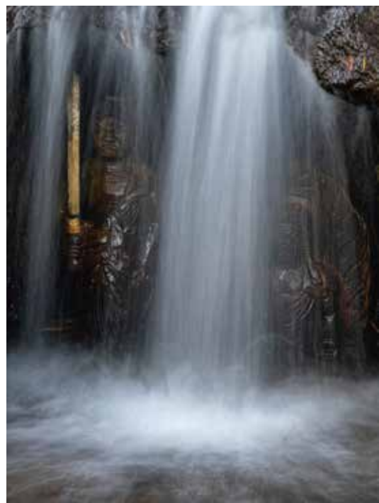
第32回みちのく宮城の小京都・村田 フォトコンテスト 村田町長賞「清流不動明王像」