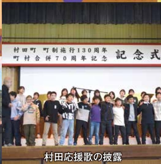
村田応援歌の披露