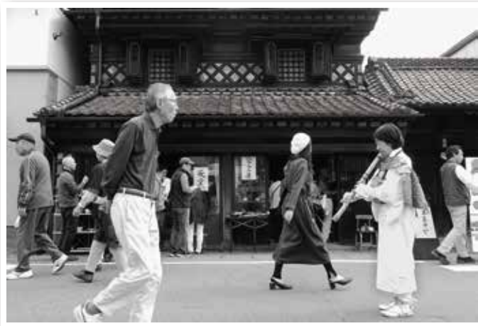
第33回みちのく宮城の小京都・村田 フォトコンテスト 村田町長賞「尺八を吹く人」