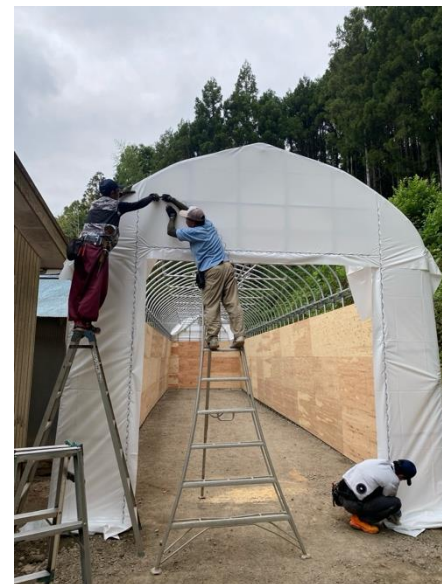
米糠用のハウスを1から建設